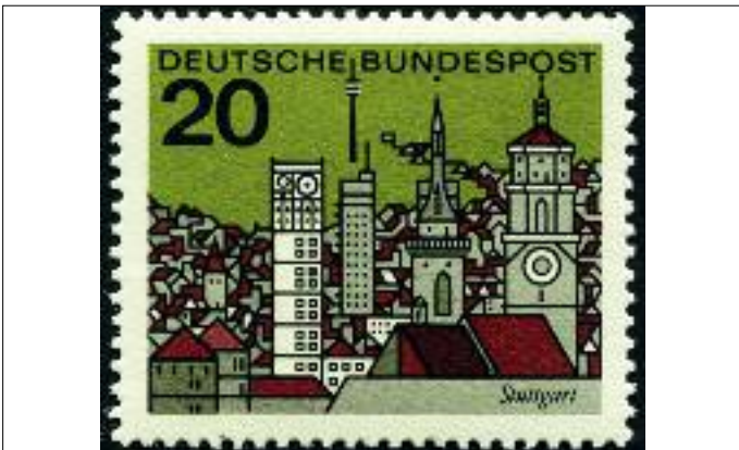
Eine Stuttgart-Ansicht auf einer Marke der Deutschen Bundespost von 1965.

Eröffnet wird die Ausstellung mit einer kleinen Feier am 28. August, um 15 Uhr, sofern es die Corona-Situation zulässt. Ein Vertreter des Philatelistenvereins wird dabei die markenhistorischen Aspekte beleuchten, ein Kurator die stadtgeschichtlichen Zusammenhänge.