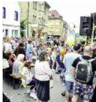
Fußgänger erobern den Straßenraum

FSJ-Kraft der Stadt. Doch immer wieder neue Hürden taten sich auf, neue Vorschriften, Auflagen, Forderungen nach Sicherheitskonzepten und Kostensenkungen. Im Zuge der Abrechnung 2019 wurde im Bezirksbeirat lange über die höheren Kosten und einen daraus resultierenden Zuschuss von insgesamt 10 000 Euro diskutiert. In anderen Jahren wurde teilweise nicht einmal die Hälfte an Zuschuss gebraucht – und das bei einem riesigen Fest. Denn die Aktiven haben immer alle Hebel in Bewegung gesetzt, um sparsam zu wirtschaften und Geld einzunehmen, zum Beispiel mit dem Bündelverkauf oder mit Anzeigen im ehrenamtlich erstellten Programmheft. Nun ist die Organisation mangels Ehrenamtlicher an eine Agentur übertragen, die für eine deutlich kleinere, ganz andere Veranstaltung 15 000 Euro bewilligt bekommt. Ohne Diskussionen. Dass der