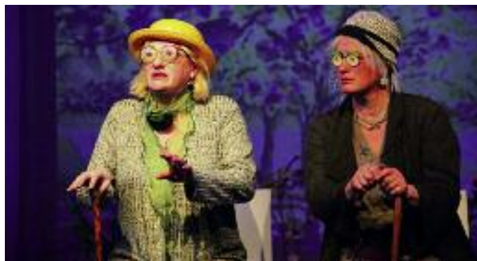
Dein Theater spielt „Ewig und drei Tage“ im Hof.