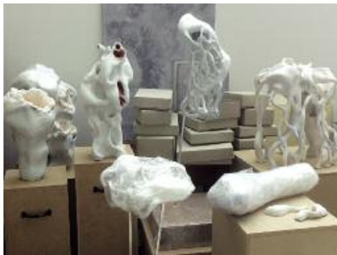
Keramikarbeiten von Christof Sölller.

Projektraum Ostend Achalmstraße 18/Ecke Haußmannstraße, Stuttgart www.projektraum-ostend.de