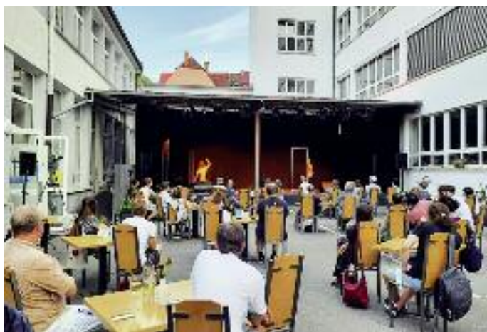
Vielversprechend: der Sommer im Hof des Kulturwerks

Vorverkauf und Reservierung unter www.kulturwerk.de . Kulturwerk, Ostendstr. 106 a, Telefon 4 80 65-45, www.kulturwerk.de .